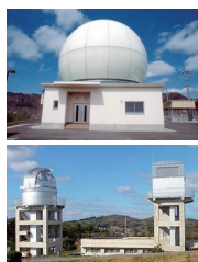
上齋原スペースガードセンター (レーダー観測設備) Kamisaibara Space Guard Center (Radar facility)